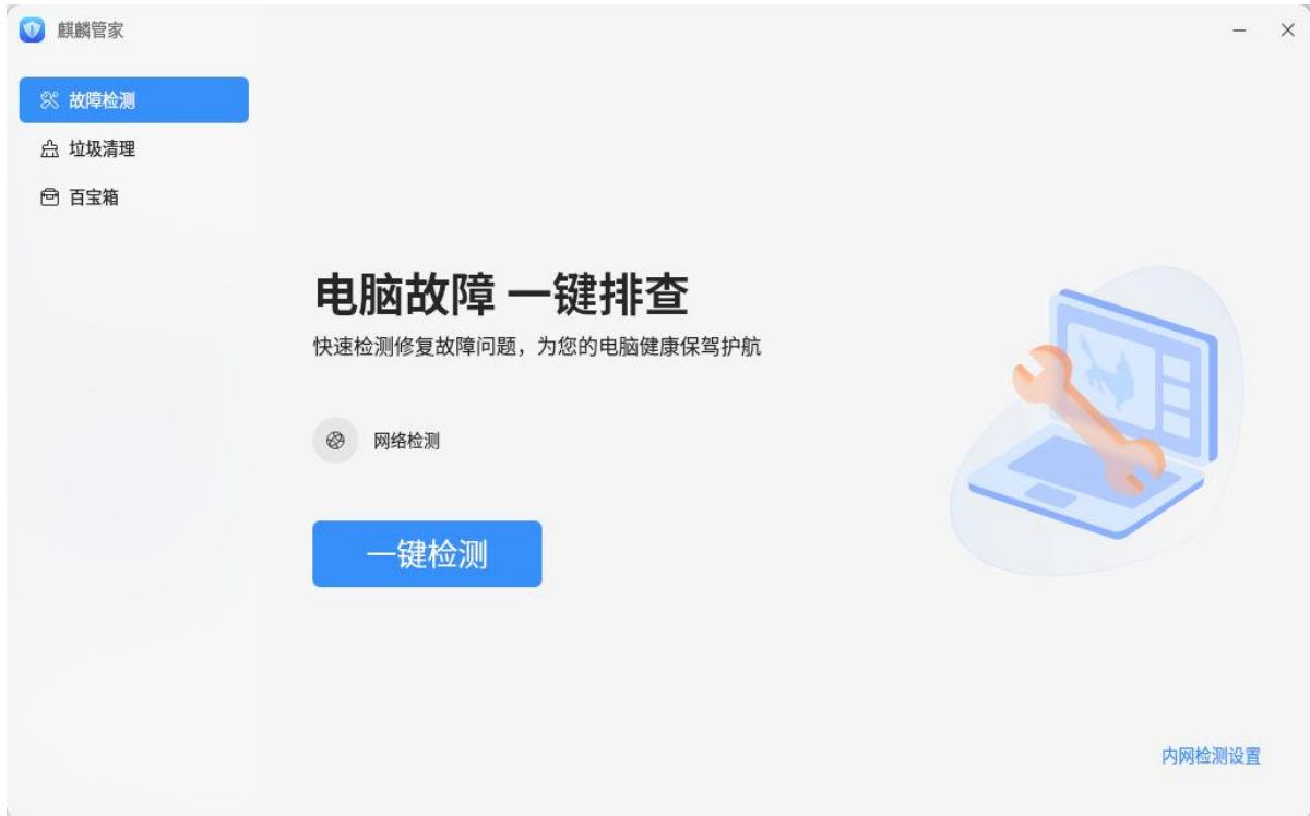
图 3 -2 麒麟管家