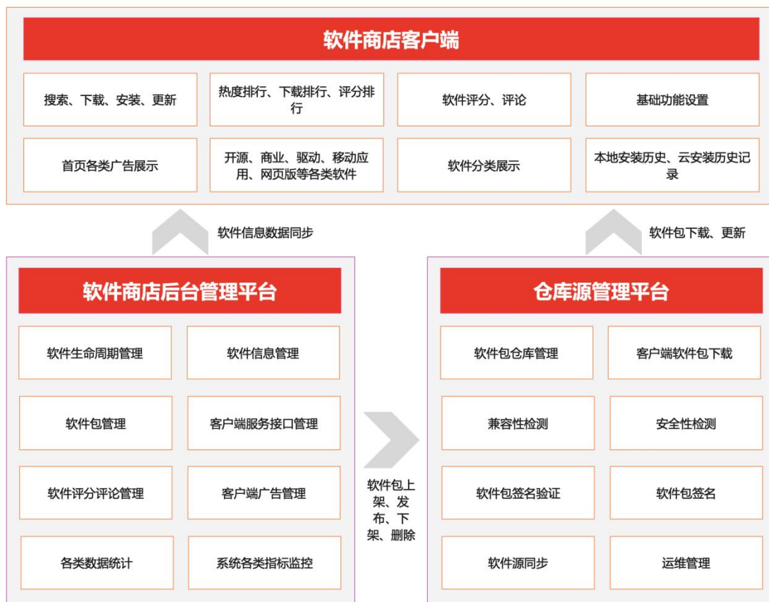
图 3 -4 私有化部署整体架构图

进行软件的上架、下架、更新等运维管理。提供一套完整、标准的软件商店（私有化版）解决方案，以解决内网环境下无法下载软件、管理软件的问题。整体架构图如下：