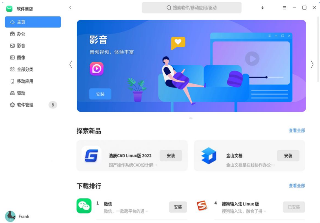
图 3 - 1 软件商店登录界面